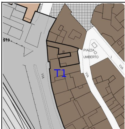
ESTRATTO REGOLAMENTO URBANISTICO