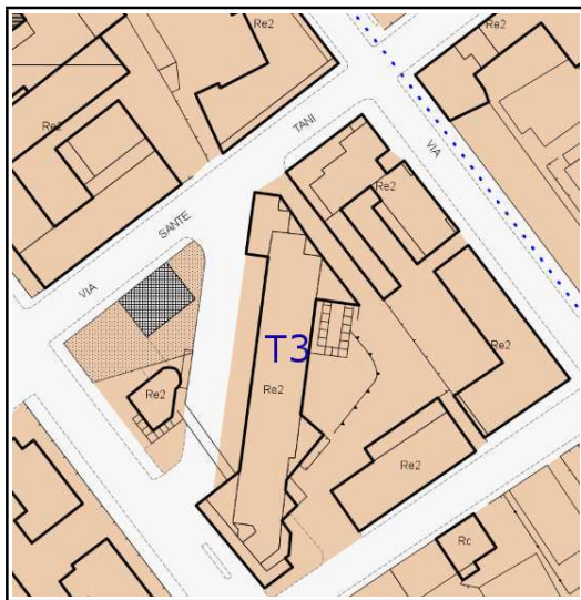
ESTRATTO REGOLAMENTO URBANISTICO