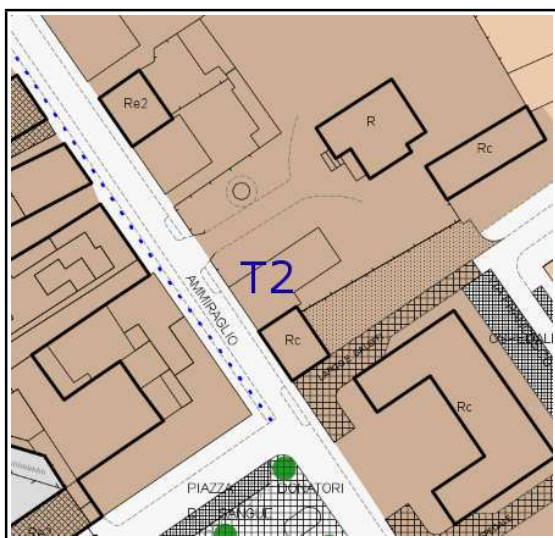
ESTRATTO REGOLAMENTO URBANISTICO