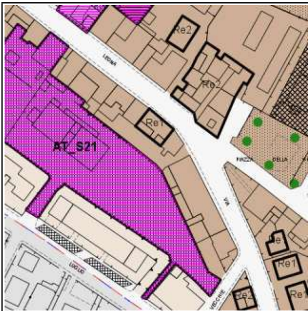
ESTRATTO REGOLAMENTO URBANISTICO