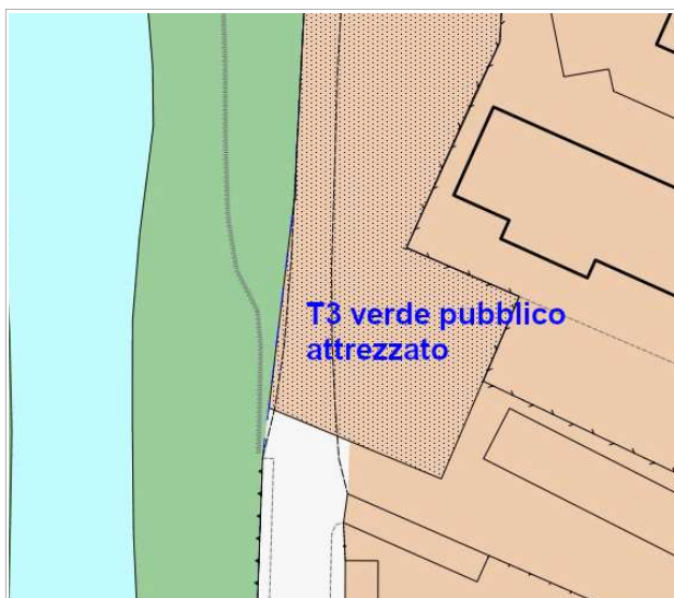
ESTRATTO REGOLAMENTO URBANISTICO